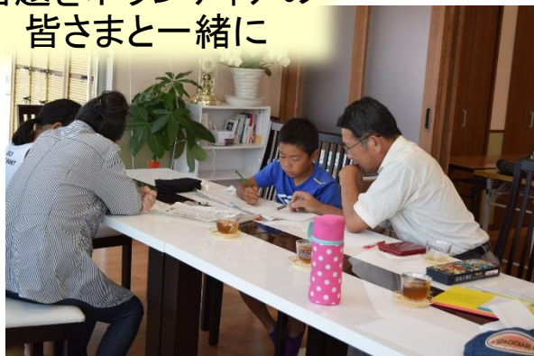
宿題をボランティアの 皆さまと一緒に